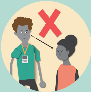
एकोहोरो घोरिएर नहेर्ने