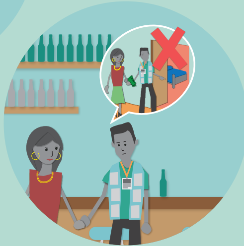
यौन सम्बन्धका लागि पैसा नतिर्ने