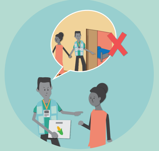
यौन सम्बन्ध, चुम्बन वा डेटका आधारमा मद्दत वा सहयोग प्रदान नगर्ने