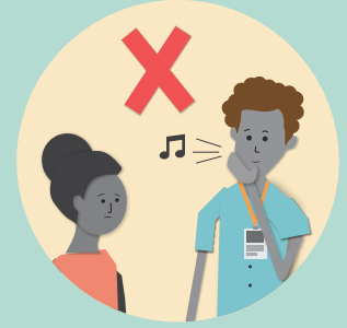
मुखले सिटी नबजाउने