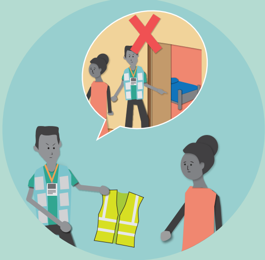
यौन सम्बन्ध, चुम्बन वा डेटका आधारमा कामको वाचा नगर्ने