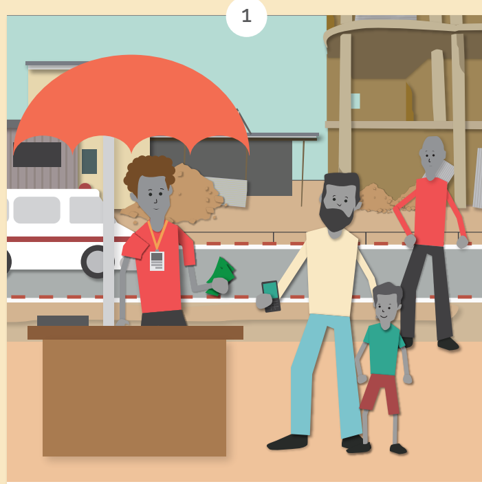
آئون پنهنجو ڪم ڪري رهيو هئس.