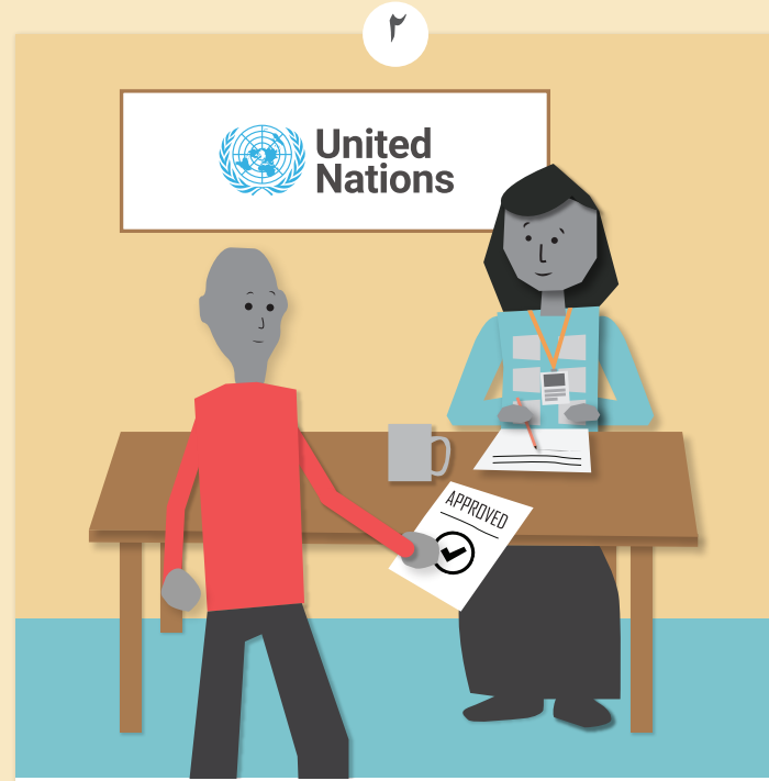
میرے پاس کو بحران سے متاثرہ لوگوں کی مدد کے لئے اقوام متحدہ سے کچھ رقم ملی