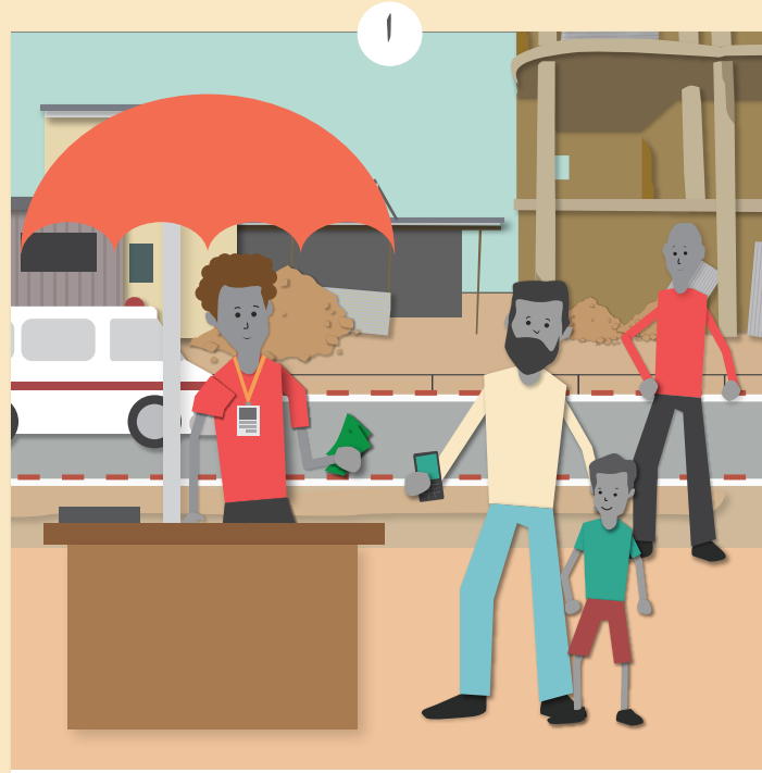
میں اپنا کام کر رہا تھا