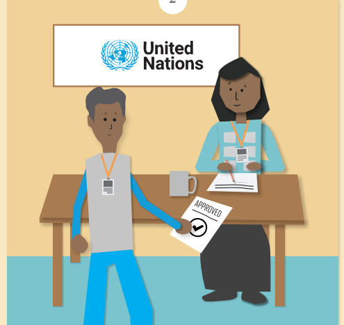
ሓለቓይ ነዮም ብሰንኪ ቐልውላው እተገድኡ ሰባት ንምሕጋዝ ካብ ውድብ ሕቡራት ሃገራት ዝተወሰነ ገንዘብ ረኺቡ።