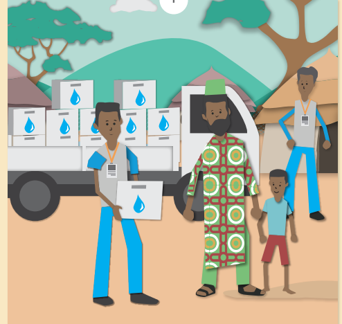
ስርሐይ እየ ዝሰርሕ ነይረ።