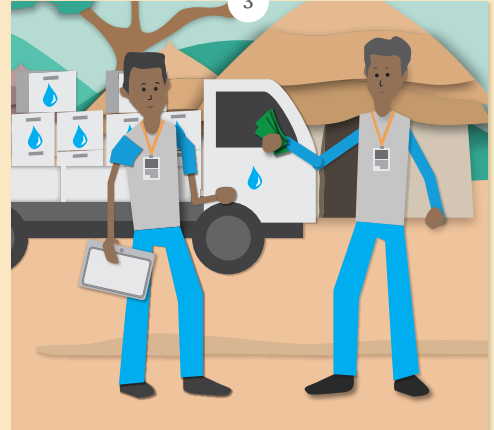
ሕጂ ገለ ካብቲ ካብ ውድብ ሕቡራት ሃገራት ዝርከብ ገንዘብ ይኸፈለኒ ኣሎ።