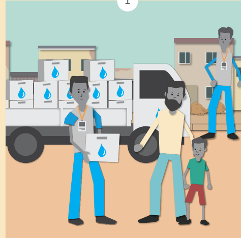
ကျွန်ုပ်သည် ကျွန်ုပ်၏ ပင်မအလုပ်ကိုသာ ဆောင်ရွက်နေခဲ့ခြင်း ဖြစ်ပါသည်။