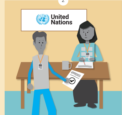
ကျွန်ုပ်၏ အထက်အရာရှိသည် ဘေးဒဏ်သင့်သူများအား ကူညီရန်အတွက် ကုလသမဂ္ဂအဖွဲ့ (UN) မှ ငွေကြေးတစ်ချို့ ရရှိထားပါသည်။